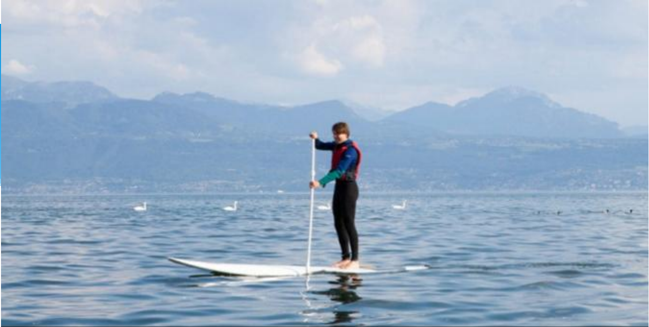
activité / STAND UP PADDLE (SUP)