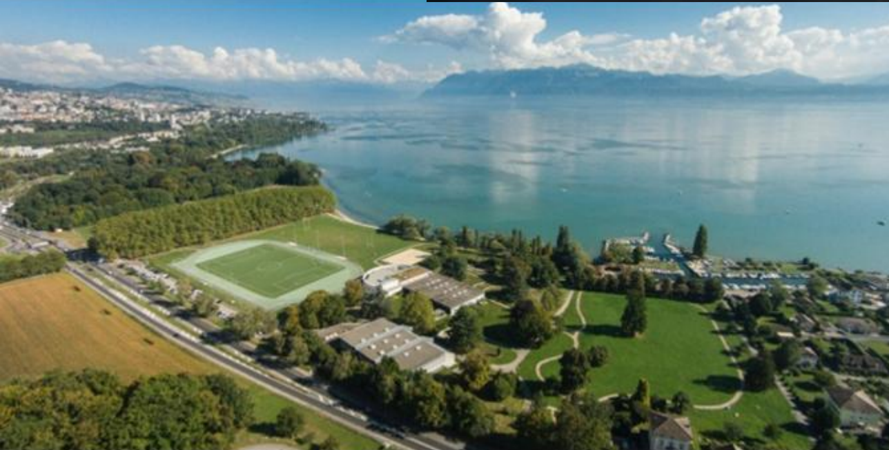
CENTRE SPORTIF UNIVERSITAIRE DE DORIGNY