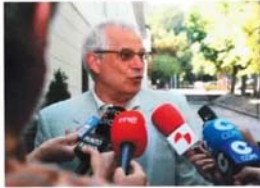
José Borrell. Ex-Presidente del Parlamento Europeo