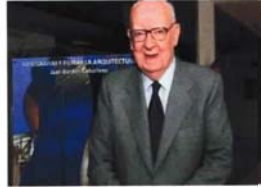
José Luis Borau. Director de cine