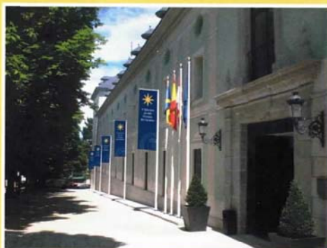
Centro de Congresos y Convenciones de la Granja de San Ildefonso (Lugar de celebración de los Cursos)