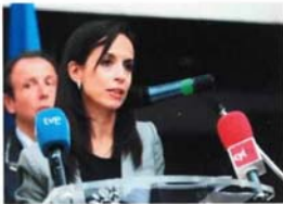
Beatriz Corredor. Ministra de la Vivienda