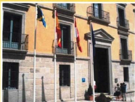
Parador de la Granja de San Ildefonso (Alojamiento Conferenciantes)

La Universidad Politécnica de Madrid (UPM) organiza sus Cursos de Verano con el fin de dar a conocer a la sociedad, a los medios de comunicación, a sus estudiantes y a su personal, temas de actualidad e interés social relacionados con las enseñanzas y la investigación que realiza la UPM, en un ambiente relajado y tranquilo. El perfil de los Cursos es fundamentalmente divulgativo, pero manteniendo el rigor y la calidad de cualquier actividad universitaria.