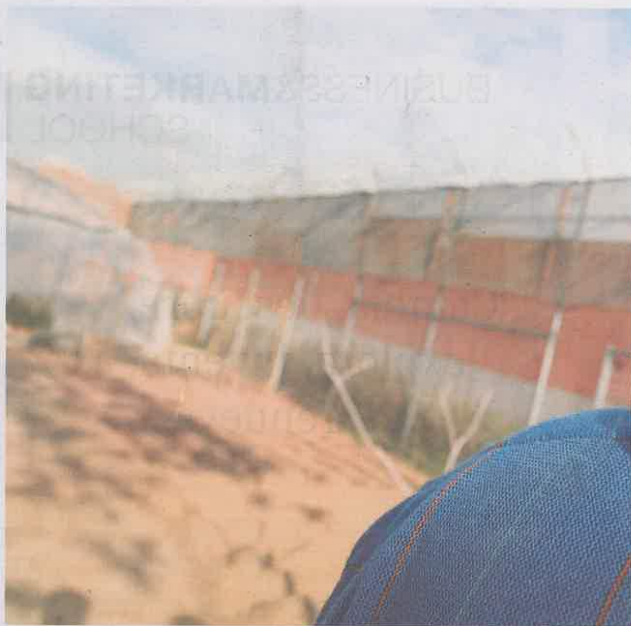
Pocas universidades ofertan entre sus posgrados másters de este sector potencialmente emergente.

La razón de ser de estos estudios la da la situación actual que se vive en España: más del 12 % de la población, según datos del INE, lo componen ciudadanos inmigrantes; se han registrado las cifras más al-