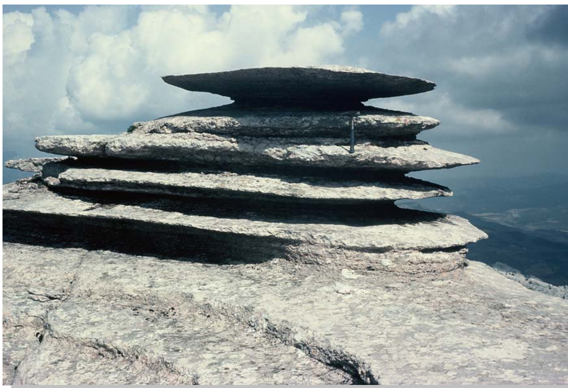
OPCIÓN B. Figura 2

El Tornillo del Torcal de Antequera (Málaga).