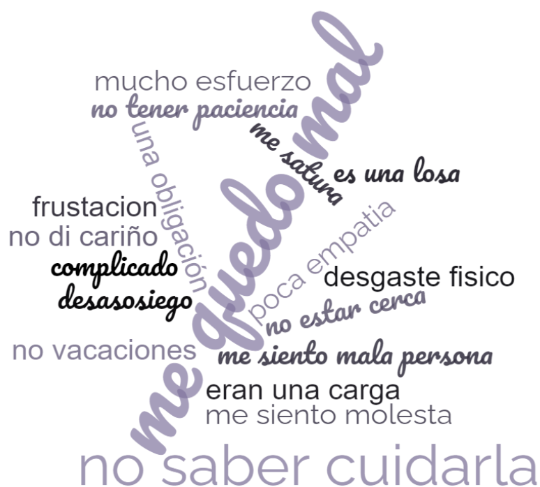
Figura 2. Palabras y frases cortas utilizadas por las mujeres para expresar su sentimiento de culpabilidad y frustración.

"...por un lado, la satisfacción de ayudarlo y, por otro lado, te sientes mal contigo misma porque yo digo que esto quiero que se acabe y volver con mi vida..."